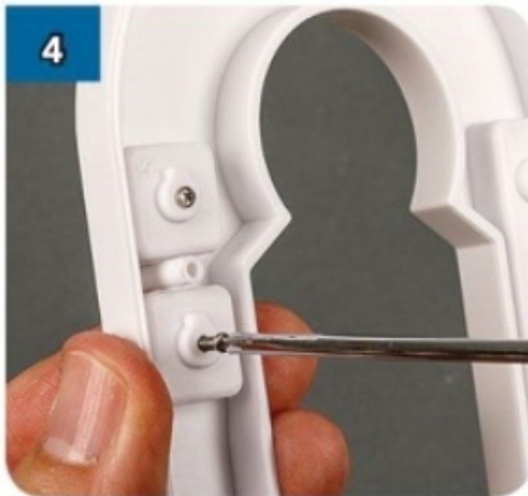
4 Aggiungi il secondo ingrassatore nello stesso modo.