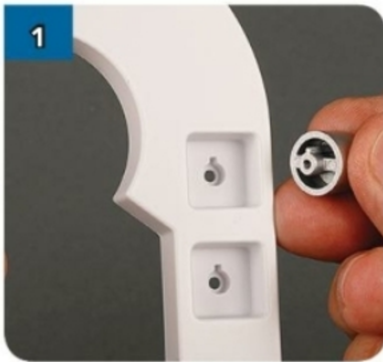
1 I perni degli ingrassatori vanno inseriti nei fori a forma di serratura della placca.

Le tre finiture metalliche vanno fissate con quattro viti argentate da 2x6 mm, fornite nell'uscita 35.