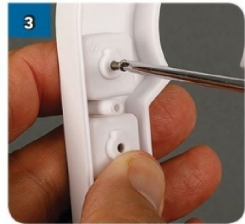
3 Capovolgi i pezzi e avvita una vite nel foro sulla placca opposto all'ingrassatore.