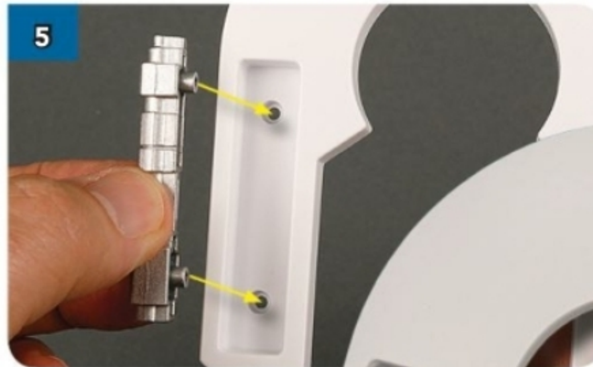
5 Inserisci lo stabilizzatore, orientalo come mostrato in foto.