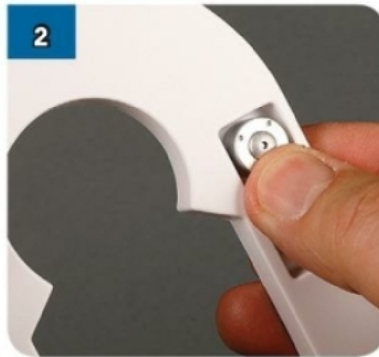
2 Premi a fondo il primo ingrassatore nella sua sede.