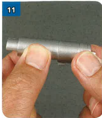
11 Unisci con decisione le due parti tra loro.