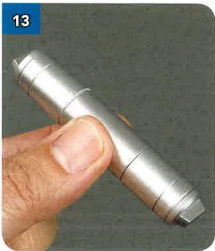
13 Unisci le parti. Ecco come dovrebbe apparire il primo filtro completo.