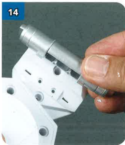
14 Allinea le due alette e i perni del filtro con le aperture e i fori corrispondenti della placca BP-61.