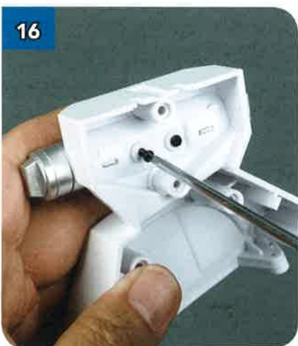
16 ... e fissalo inserendo due viti nere autofilettanti da 2,3x6 mm nei fori centrali all'interno della placca.