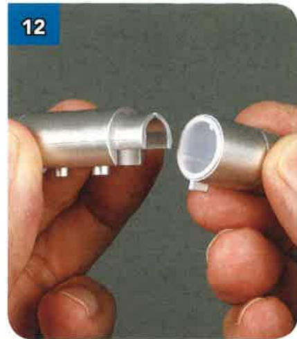
12 Allinea l'altra estremità del cilindro BP-39 con le alette interne del cilindro corto BP-69 come fatto al punto 10.