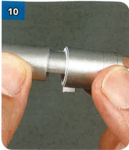
10 Allinea le alette interne di uno dei cilindri corti con le scanalature interne di BP-39.